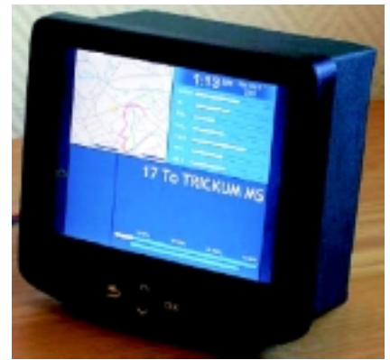
Joonis 4. Sõidukitesse paigaldatav pardaarvuti C90Plus. Arvutisse sisestatakse linna kaart, millel kuvatakse bussiliini kulgmine ja liikumine reaajas.

Projekti viimaste kuude jooksul viiakse läbi tulemuste hindamine ja linnaelanike teavituskampaania. Prioriteedisüsteemi eelhindamiseks paigaldati projekti esimesel aastal kuude TAK-i bussi ja kuude TTTK trollibussi automaatsed sõitjaloendussüsteemid. Hangitava süsteemi kiire tasuvuse korral varustatakse veel rohkem ristmikke ja sõidukeid vajaliku riist- ja tarkvaraga. ■