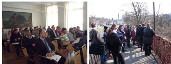
Exkurze CIVINETu do Ústí nad Labem, 19. 3. 2015