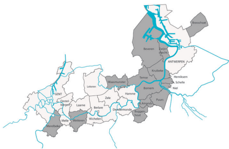
Figuur 1: Geografische spreiding van de deelnemende gemeenten van de IGS-SLP (donkergrijs)